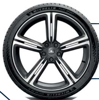
PILOT SPORT S5 01:27:62