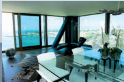
Über den Dächern von Cascais: Die ganz private Penthouse Suite in einem der luxuriösesten Hochhäuser Portugals.