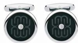
Onyx Brillant, Edelstahl mit schwarzem Onyx und Brillanten, zusammen 0,06 ct., G-VS (feines Weiß, kleinste Einschlüsse), 495 Euro

Bei dem feingliedrigen Bracelet und den passenden Ohrhängern wurde der brillantbesetzte Lacrima-Tropfen in expressiver Größe dargestellt. Der schlichte, zeitgemäße Stil Diamanten zu tragen und passend zu jeder Tages- und Nachtzeit.