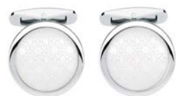
Edelstahl Signet Rapport, 99 Euro