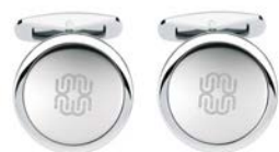
Achat Signet, Edelstahl mit weißem Achat, 99 Euro

Ob moderner, weißer Achat, sportlicher, schwarzer Onyx oder eleganter Edelstahl, jeweils mit oder ohne Brillanten: Vor dem Hintergrund eines dezenten Wempe Signets bringt jeder einzelne Manschettenknopf das individuelle Stilbewusstsein optimal zur Geltung.