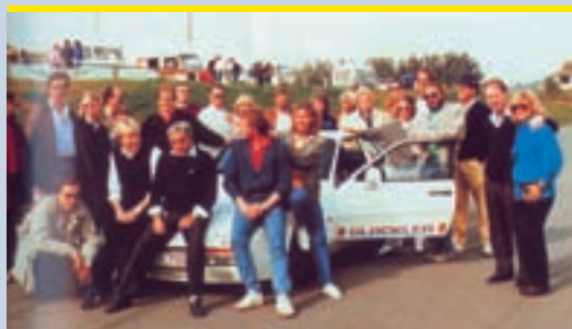
Damals wie heute der weltweit größte Markenclub: Porsche