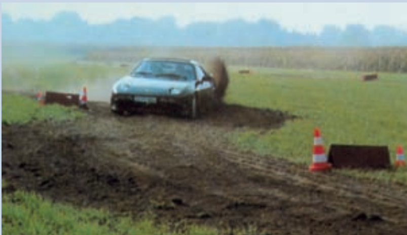
Eine Slalom-Veranstaltung der ganz besonderen Art